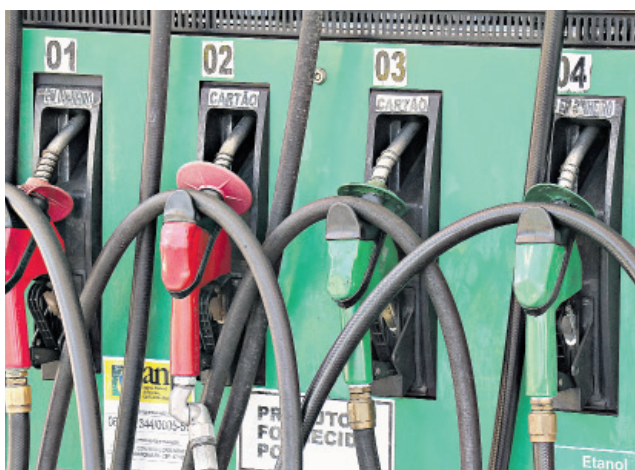
Nas bombas, a gasolina acumulava, até a semana passada, aumento de 36% no ano, já descontada a inflação do período

O cenário levou o presidente Jair Bolsonaro (PL) a afirmar no início do mês que a Petrobras estava prestes a anunciar redução de preços. O reajuste não ocorreu na semana indicada pelo presidente da Repúbli-